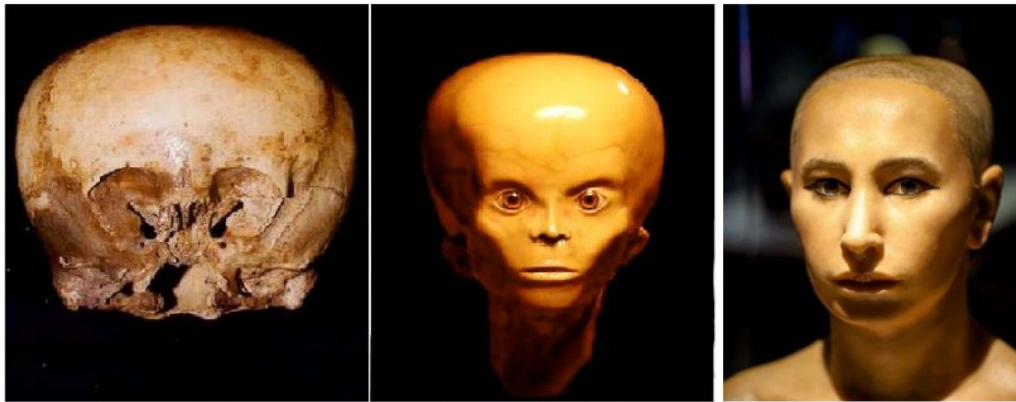
Original Starchild Skull

Si uno mira las imágenes de este cráneo se puede ver la verdad. Akhenaton también era un híbrido Gris-Humano. Su hijo el Rey Tut, que murió cuando era joven, parece idéntico cuando se le pone al lado del Cráneo del Niño Estrella.